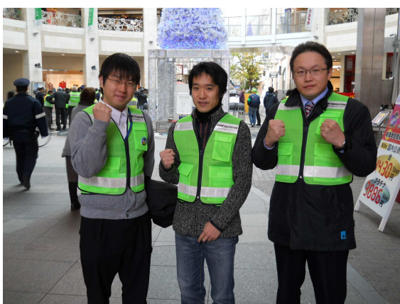
力強いガッツポーズ!!

高松丸亀町ガーディアンズは、高松市丸亀町商店街の個人商店店主が中心となり、「自分たちの街は、自分たちの手で守ろう。」という意識から結成された自警団です。