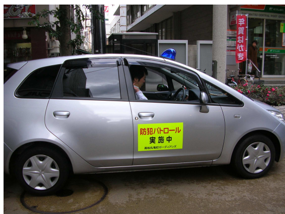
高松丸亀町ガーディアンズ 青色防犯パトロール車