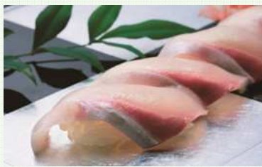
ハマチの握りずし

香川県は、世界で初めてハマチの養殖に成功した、近代的な海産魚類養殖発祥の地です。