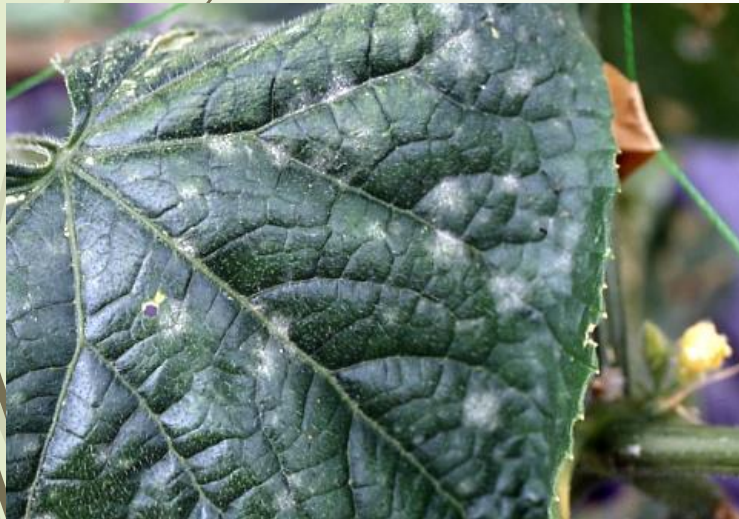
キュウリうどんこ病 (糸状菌)