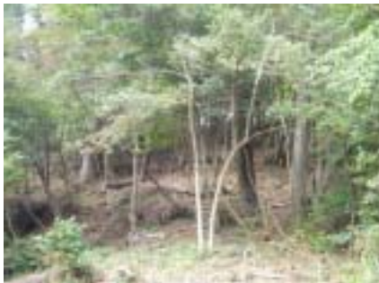
下刈りと灌木の間引きをして少しすっきりしました。