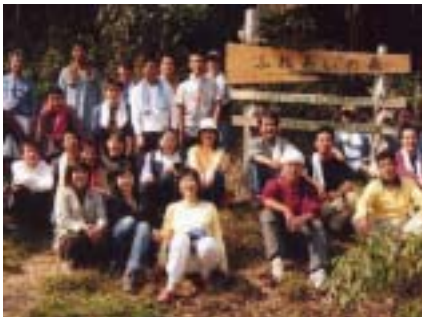
コープかがわの仲間たち。

区画の湊です。平成15年度「里山オーナー制度」の募集があったとき、コープかがわの組合員代表地域理事をしていたので、この里山がエリア内にあり、独自のエリア活動を進める中で借りることにしました。山仕事をしたことのない素人で、しかもはじめは足の踏み場もないヤブ状態でしたので「これは人海戦術しかない！」と時候のよい時期に友人やコープの職員さん(共同購入を配達しているお兄さん?)と約20名くらいで何度か作業をしに来ました。コープの職員は日・月曜日が定休日なので、それに合わせて午前中約2時間作業し、お昼はおにぎりやしっぽうどん、豚汁などを現地で作り、みんなで食べて解散します。参加した人たちからは「ストレス解消になる」、「日頃なかなか体験できないことができた」、「自然の中で空気がおいしい」、「山で食べるごはんはおいしい」と喜んで毎回参加してくれる人もいます。しかし、私自身は最近ぜんぜん行けていません。オーナー会の集まりで下の会場までは行っても、自分の区画まで行けずに帰ってしまう...という状態です。