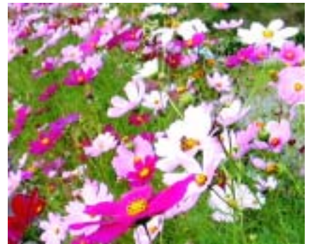
メイン看板近くのコスモス

ところで、今回は私が趣味の溪流釣りを通じて感じた里山論を述べさせていただきます。四国の溪流釣りの対象はアマゴですが、天然物はあまりおらず、ほとんどが養殖魚の放流に頼っています。香川の人にはアマゴ釣りはあまりなじみがありませんが、徳島や高知の溪流では3月の解禁になると平日は地元の手練(てだれ)、休日は町の溪流マンがどっと押し寄せます。そのため毎年相当数のアマゴを放流しても早期に釣り去