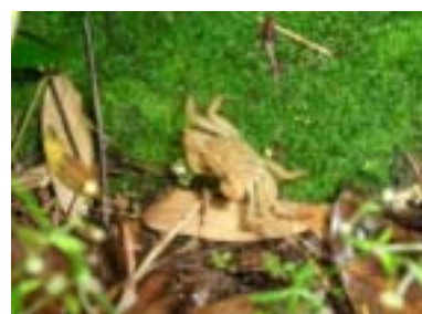
山の中でカニ発見!(さぬき市鴨庄地区)

里山オーナーの皆様、はじめまして。県の森づくり・緑化担当は4月の人事異動により、引き続いて森が、新たに安藤、岡、蓮池、石丸が加わりました。よろしくお願ひします。さて、里山オーナー地区は平成17年度に2地区募集し、現在、県下で6地区となっています。17年度募集地区のひとつである三木町鹿庭地区には18区画が設定され、現在11名(9月11日現在)のオーナーさんが活動しています。特徴は平均傾斜が他地区に比べてやや急なこと、近くに乳牛の牧場があることです。牧場の方には駐車場、会議場所の提供などをしていただき大変お世話になっています。さぬき市鴨庄地区には13区画が設定され、現在6名(9月11日現在)のオーナーさんが活動しています。鴨部川から東へ入った北向きの斜面です。里山整備後には瀬戸内海が望めるのではと思われる区画がいくつかあります。6月には駐車場脇の山中にカニが見つけた。写真のカニは白っぽいですが真っ赤なカニもいて、水がないのにどうやって生きているんだろう?と驚きました。皆様の地区ではシカやイノシシに遭遇するそうですね。普段の生活にはない新鮮な驚き、これも里山の恵みだと感動したものです。両地区ともまだ空き区画がありますので、皆様のお知り合いの方に紹介していただくと有り難く思います。これからの季節、お気を付けて秋の里山を楽しんでください。(香川県みどり整備課)