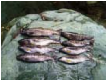
これだけ釣れたら大満足(穴吹川源流)

次に徳島県の三嶺(1893m)のふところを流れる祖谷川支流の四ツ小屋谷での単独釣行です。前夜からワクワクして一睡もできないまま午前3時ごろ家を出発しました。登山口への林道は通行止めになっていましたが、まだ暗かったので誰も見ていないと思い、そのまま車で進入。途中かなり荒れていましたが、何とか林道終点の登山口までたどり着きました。普通の人はこちらから三嶺に登るのですが、「こんなにはるばる有名な三嶺の登山口まで来て、上らずに逆に下って谷に降りるのは我ながら天邪鬼だな。これってすごい贅沢。」なんて考えながら、一人でほくそ笑んでいました。午前6時、登山口から下山して四ツ小屋谷に入りました。