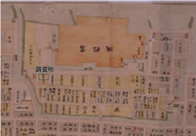
高松城跡（高松北警察署）の位置 （「讃州高松地区」）（享保年間）