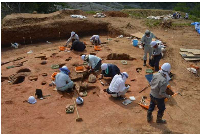
内山遺跡（宮城県女川町）調査風景