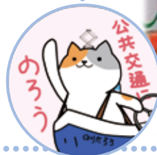
公共交通利用促進キャラクター のりたろう