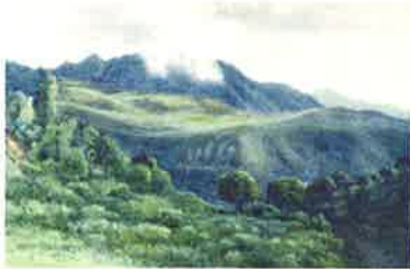
丸山晩霞 初夏の志賀高原 1909年頃

*烏水は香川県の旧高松藩士の家に生まれ、幼くして横浜に移り住み、明治38年山岳会(現日本山岳会)創立に参画。さらに紀行作家、浮世絵・版画コレクターとして活躍し、山岳風景画の発展に影響を与えました。