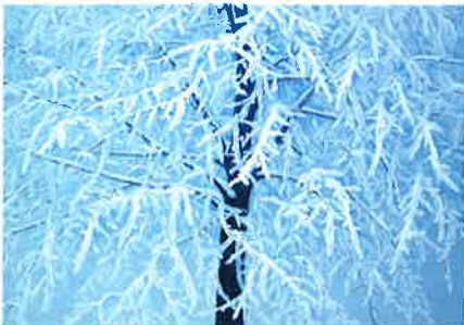
東山魁夷 露氷の譜 1985年