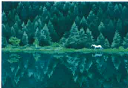
東山魁夷 緑響く(習作) 1972年