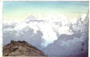
吉田博 駒ヶ岳山頂より 1928年