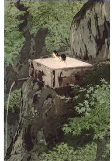
笠松紫浪 信州白岩温泉 1935年