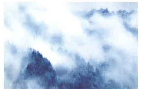
東山魁夷 雲湧く嶺(スケッチ) 1973年